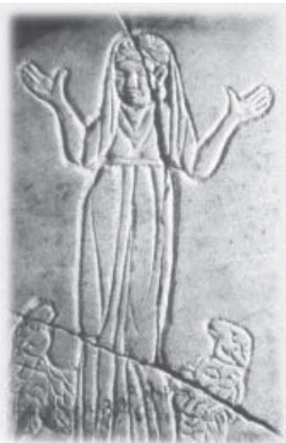
Moteris krikščionė pavaizduota romėnų