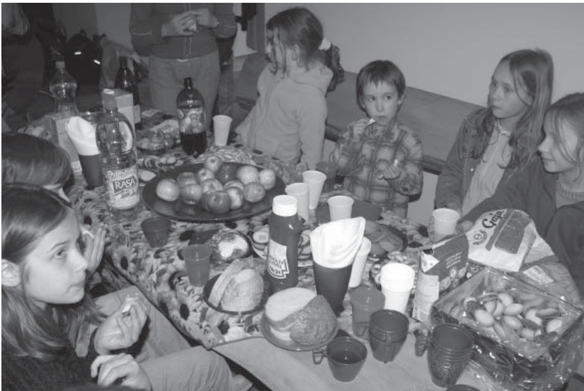
Sekmadieninės mokyklėlės uždarymas

■ Biržų savivaldybė iš 2006 metų vaikų ir jaunimo socializacijai skirtų lėšų paskyrė Vaikų poilsio programoms vykdyti viešajai įstaiagai „Vaiko užuovėja“ ir LERJD „Radvila“ po 2000 Lt.