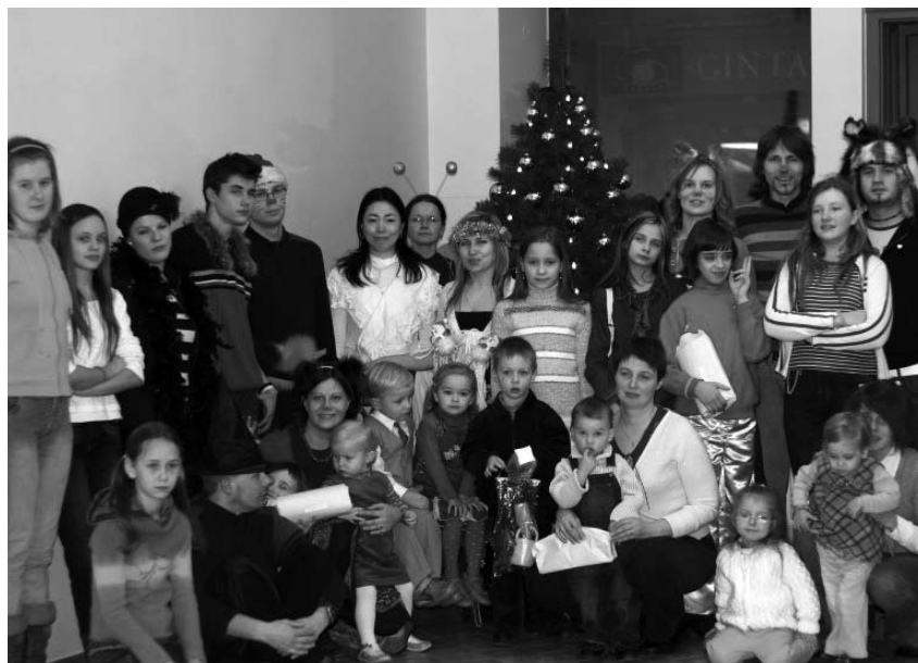
2006 m. gruodžio 28 d. Signatarų namuose Vilniaus jaunieji reformatai džiaugėsi Kalėdų eglute