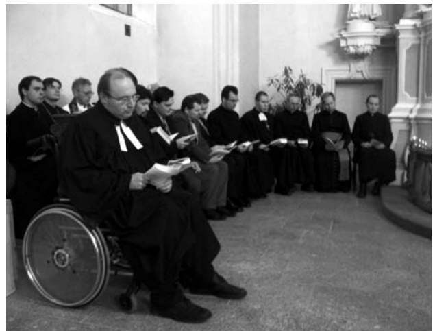
Nuotraukose: Ekumeninės savaitės vaizdai Vilniaus Tikėjimo žodžio ir Evangelikų liuteronų bažnyčiose.